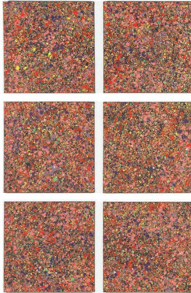
Rolf Gerhards, Celan-Bilder 6 Tafeln, je 50 x 50 cm, Acrylfarbe auf Leinwand, 1991